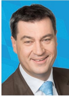
M. Söder Dr. Markus Söder, MdL Staatsminister